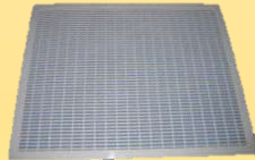
Роздільна решітка П.І. Прокоповича (сучасний вигляд)

Уміщення сот у дерев'яні рамки, планки яких обмежують їх з усіх боків – винахід Прокоповича для цілісності сот.