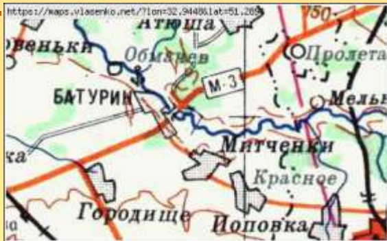
Топографічна карта 1:1000000

Петро Іванович народився 29 червня 1775 року в селі Митченки Бахмацького району Чернігівської області в сім'ї священника. У 1794 році закінчив Києво-Могилянську академію. Служив у Переяславському кінно-єгерському полку, потім в Херсоні й Одесі. У 1798 році через хворобу пішов у відставку в чині поручика і повернувся до батьківської оселі. З 1799 року почав займатися бджолами на пасіці свого молодшого брата. Згодом придбав власну пасіку. У 1802 році пожежа знищила його садибу в Митченках. Збереглася лише одна пасіка. Для власного помешкання збудував землянку. У цей період він орав, сіяв, косив, збирав жито, доглядав худобу, займався городом, працював столяром, теслею, виготовляв цеглу, але продовжував займатися бджолами [2].