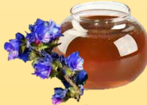
Мед з синяка