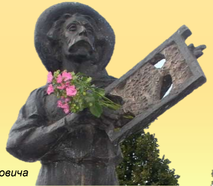
Могила Прокоповича Петра Івановича

«Призначивши себе одній галузі сільського господарства – бджільництву, я присвятив йому все своє життя, всі помисли, всю увагу...»